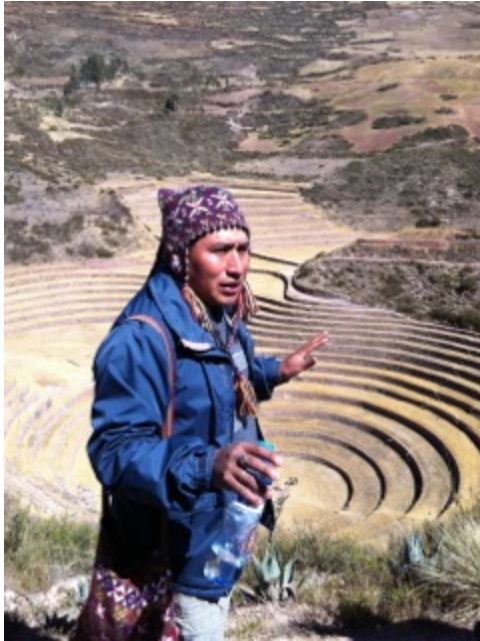
Puma at Moray, the womb of Pachamama.

Vi besöker Moray, Pachamamas (ModerJord) livmoder.